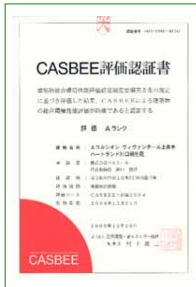
2006年1月31日竣工の当社建物のCASBEE評価証明書