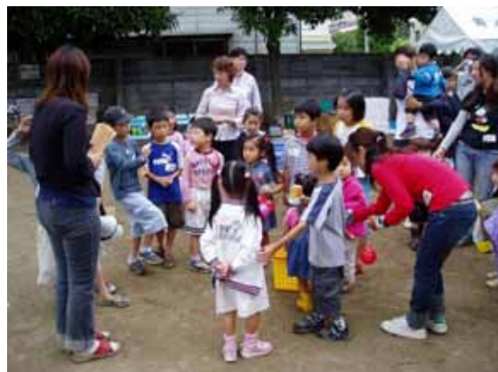
2004年8月28日、ファーストエココミュニンの一コマ

当社管理マンションのエコルシオン・グランデール青木イースト・ウェストを中心としたリサイクルのネットワークがエコルシオンエコリサイクルネットワークであり、当社はネットワークのコーディネーターとして、参加者、地域店舗、協力企業、行政との協働により、資源のリユース・リサイクルを参加者が楽しく行うことで、環境活動の実践につながるように、継続的に企画・推進・実施することにより、ごみの減量と資源の循環を促進している。また同